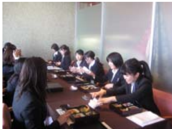
写真 9 会場の様子 (懇談する女子学生の皆さん)

粒子・流体プロセス部会では、本会に続く第二弾として、来る 2011 年 12 月 2 日(金)12:30 ~、「若手研究者のためのランチ会」を学士会館にて開催する予定である。今回は、ポスドクや博士課程在学または進学を予定している学生を対象とし、実際に企業でご活躍の博士を招いて、双方の活発な交流を図りたいと考えてい